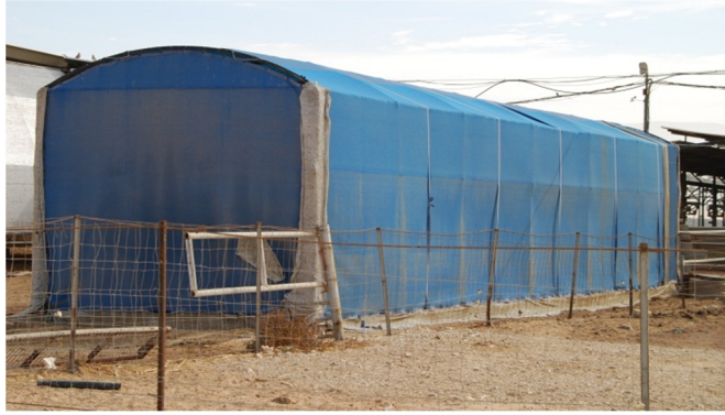
תמונה 2. כיסוי הבור להפרדת מוצקים סטטי ברשת המונעת חדירת זבובים ברפת יהל